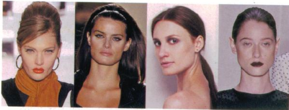
O estilo anos 60, Neon

A edição de inverno da São Paulo Fashion Week resgatou vários penteados que são clássicos da moda, a começar pelo coque alto e arrumadinho à la Audrey Hepburn, o rabo de cavalo baixo, entre outros. Confira os looks consagrados dos desfiles e escolha o que você vai adotar.